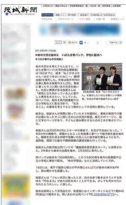
読売新聞／平成25年8月4日(日)発行 茨城新聞ウェブサイト／平成25年5月17日(金)掲載

自分を信じて、力強く生き抜いて、お父さん・お母さんから受け継いだいのちが未来へ繋がることを信じております。